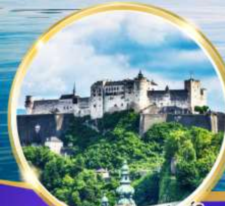
ปราสาทไฮเซนซาลส์บวร์ก