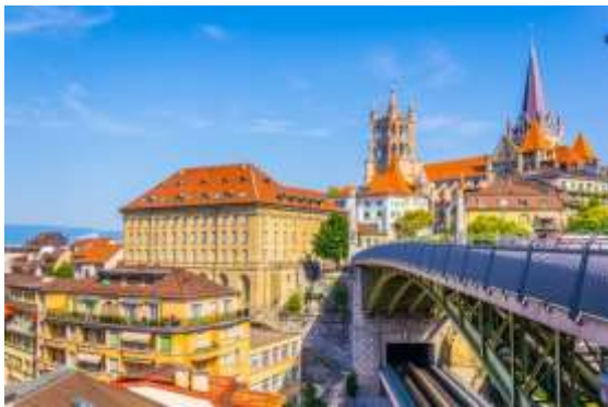
รับประทานอาหารค่ำ ณ ภัตตาคารอาหารจีน

จากนั้นนำท่านเดินทางสู่เมืองโลซานน์ (Lausanne) เมืองที่ตั้งอยู่ตอนเหนือของทะเลสาบเจนี วา นำท่านชมเมืองโลซานน์ เมืองที่เรียกได้ว่าเป็นเมืองที่มีเสน่ห์โดยธรรมชาติมากที่สุดเมือง หนึ่งของสวิส และมีประวัติศาสตร์อันยาวนานมาตั้งแต่ศตวรรษที่ 4 ในสมัยที่ชาวโรมันมาตั้ง หลักแหล่งอยู่บริเวณริมฝั่งทะเลสาบที่นี่ เมืองโลซานน์มีความสวยงามโดยธรรมชาติ ทิวทัศน์ที่ สวยงาม และอากาศที่ปราศจากมลพิษ จึงดึงดูดนักท่องเที่ยวจากทั่วโลกให้มาพักผ่อนตาก อากาศที่นี่ เมืองนี้ยังเป็นเมืองที่มีความสำคัญสำหรับชาวไทย เนื่องจากเป็นเมืองที่อยู่ในหลวง รัชกาลที่ 8 และรัชกาลที่ 9 เมื่อทรงพระเยาว์ ทรงเคยประทับและทรงศึกษาที่เมืองแห่งนี้อีก ด้วย นำท่านชมศาลาไทยเฉลิมพระเกียรติ ที่สร้างขึ้นเพื่อเทิดพระเกียรติ ในหลวงรัชกาลที่ 9 เนื่องในโอกาสทรงครองสิริราชสมบัติครบ 60 ปี และรัฐบาลไทยได้ส่งไปตั้งในสวนสาธารณะ ของเมืองโลซานน์