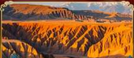
แกรนด์แคนยอนคู่ชานฉี