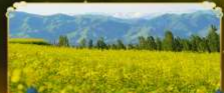
ทุ่งดอกเรปซิด