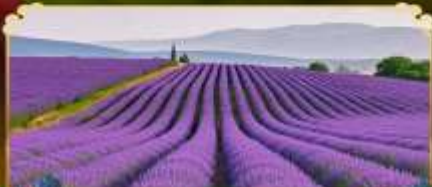
ทุ่งดอกลาเวนเดอร์