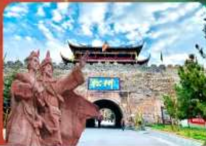
เมืองโบราณของพาน