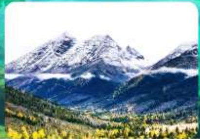
อุทยานสี่ดรุณี