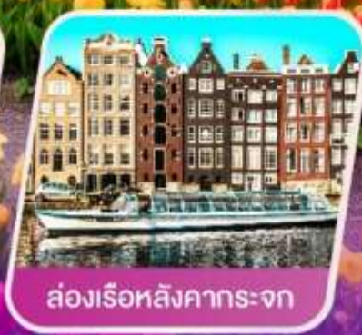
ล่องเรือหลังคากระຈก