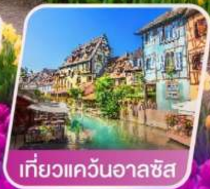
เที่ยวแคว้นอาลซัส