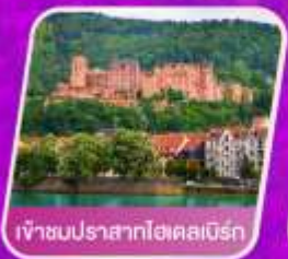
เจ้าชมปราสาทไฮคัสเบิร์ก

โรงแรม 4 ดาว อาหาร 14 มื้อ โทคนำเที่ยว น้ำหนัก 23 กก.