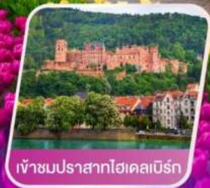
เข้าชมปราสาทไฮเคลบิรน์