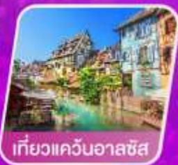
เที่ยวแควินออลซัส