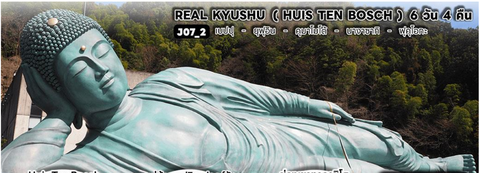
Huis Ten Bosch