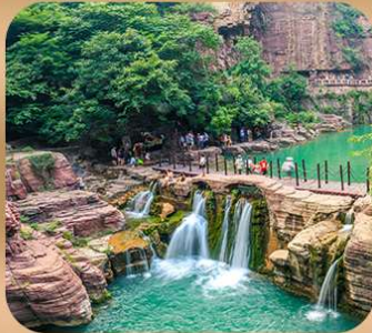
"อุทยานหยุนไท่ซาน"

ชมถ้ำหลงเหมิน มรดกโลกที่เมืองลั่วหยาง • สุสานจีนซีฮ่องเต้ • ศาลเจ้ากวนอู วัดเส้าหลิน + ป่าเจดีย์ + ชมโชว์กังฟู • เมืองโบราณลั่วอี้ • อุทยานหยุนไท่ซาน เจดีย์ห่านป่าใหญ่ • ถนนวัฒนธรรมต้าถัง • ถนนคนเดินอิสลาม • จัตุรัสหอระฆัง