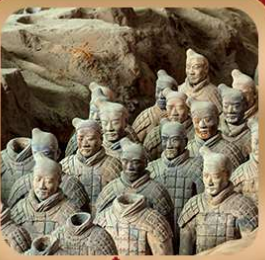
"สุสานจีนซีฮ่องเต้"