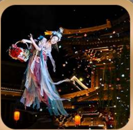
"เมืองโบราณลั่วอี้"

ชมถ้ำหลงเหมิน มรดกโลกที่เมืองลั่วหยาง • สุสานจีนซีฮ่องเต้ • ศาลเจ้ากวนอู วัดเส้าหลิน + ป่าเจดีย์ + ชมโชว์กังฟู • เมืองโบราณลั่วอี้ • อุทยานหยุนไท่ซาน เจดีย์ห่านป่าใหญ่ • ถนนวัฒนธรรมต้าถัง • ถนนคนเดินอิสลาม • จัตุรัสหอระฆัง