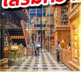
ร้านไอศกรีมมียาฮารา