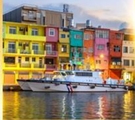
ท่าเรือประมงเจิ้งปิ่น