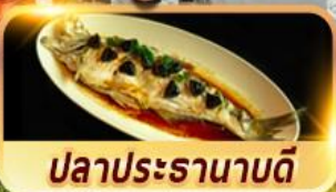
ปลาประธานาธิบดี