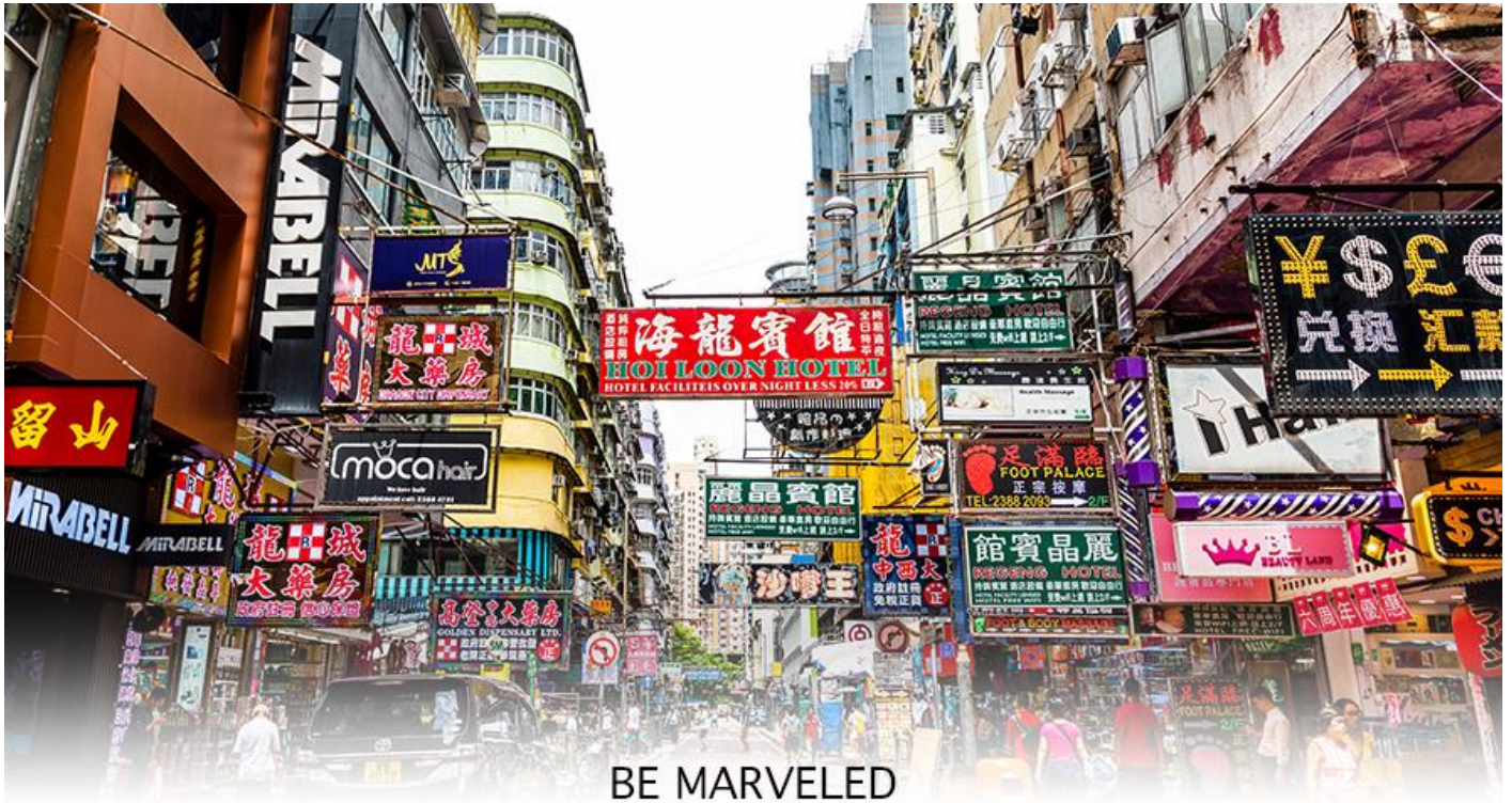
BE MARVELED MONGKOK

จากนั้นนำท่านช้อปปิ้ง ย่านมก๊ก (MONG KOK) เป็นแหล่งช้อปปิ้งที่เต็มไปด้วยตรอกซอกซอยที่มี เอกลักษณ์แปลกตา รวมทั้งตลาดเก่าแก่ที่สะท้อนเสน่ห์และวิถีชีวิตของคนท้องถิ่น ถือเป็นหนึ่งย่านยอดนิยมที่นักท่องเที่ยวทุกคนต้องแวะเวียนมา ภายในย่านมีตลาดนัด LADIES' MARKET ขนาดใหญ่ซึ่งมีร้านขายเสื้อผ้า เครื่องสำอาง รองเท้า กระเป๋า เครื่องประดับมากมาย อีกทั้งยังมีร้านอาหาร และเครื่องดื่ม ที่ขึ้นชื่อหลากหลายชนิด ให้ทุกท่านได้ลองลิ้มรสอีกมากมาย