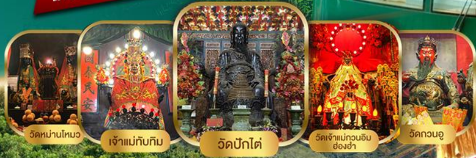
วัดหนานโหมง

ไหว้พระเสริมดวงแบบจัดเต็ม รวมขึ้นพีคแกรม