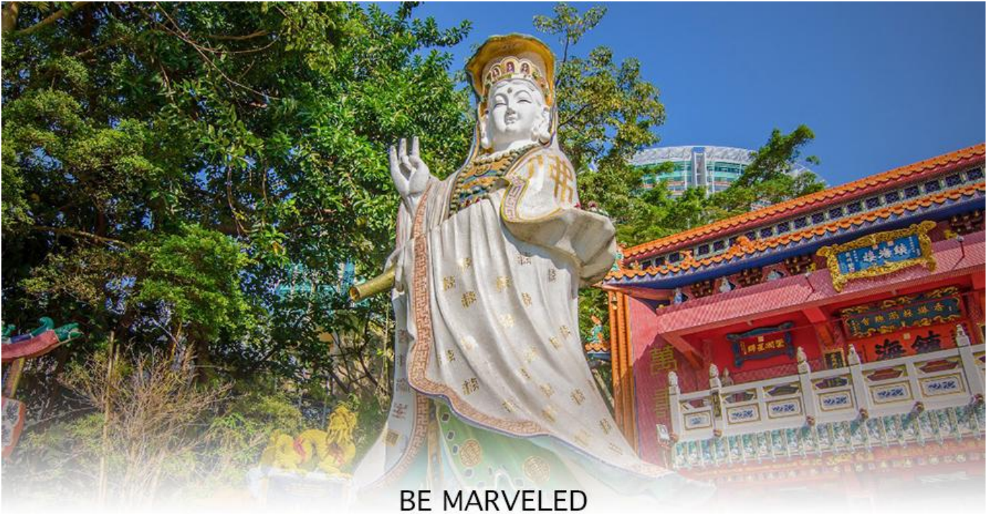
BE MARVELED วัดเจ้าแม่กวนอิมริพลีเบย์