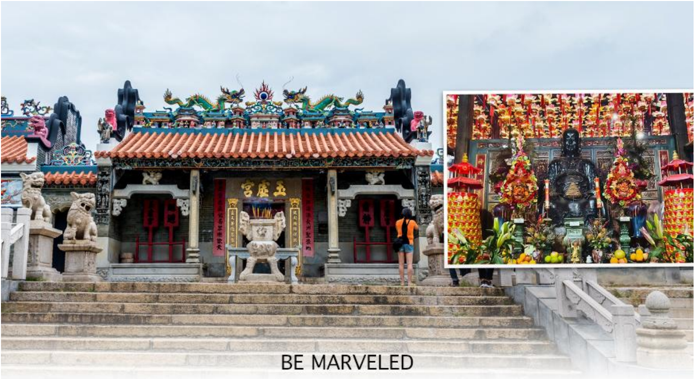
BE MARVELED วัดปักไต้