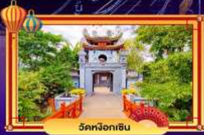
วัดม็อกอิน