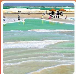
ทะเลสาบเกลือจาเอ๋อฮาน