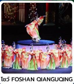
โชว์ FOSHAN QIANGQING