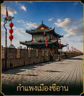
กำแพงเมืองซีอาน