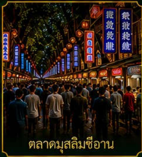
ตลาดมัสลิมซีอาน