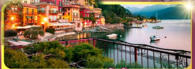
ทะเลสาบโลโค