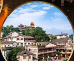
เมืองโบราณฉือจี้โข่ว