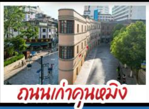
ถนนเก๋าคู่หมิง

ภูเขาหิมะมังกรหยก+กระเช้าใหญ่ วัดลามะชงจิ้นหลิน - ถนนเก๋าคู่หมิง รถไฟชมวิวกุหาหิมะมังกรหยก หุบเขาพระจันทร์สีน้ำเงิน - ช่องแคบเสือกะโจน เมนูพิเศษ ขนมหิมะสามเสพาน สุกั๊บล่าแซมมอน อาหารกว้างตุ้ง