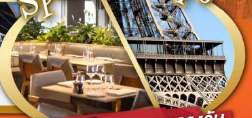
รับประทานอาหารกลางวัน บนหอคอยเฟล