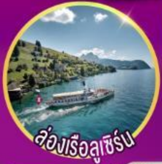
ล่องเรือลูซิิร์น