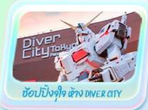
ช้อปปิ้งจุใจ ห้าง DIVER CITY