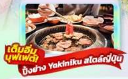
เต็มอิ่มบุฟเฟ่ต์ ย่าง Yakiniku สไตล์ญี่ปุ่น

Highlight เที่ยวญี่ปุ่นเปิดฉากความงดงามที่ต้องมาสัมผัส แลนด์มาร์คสวยวิวฟูจิ สวนโออิชิปาร์ค ตามรอยซีรีส์ดังที่เกาะเอโนชิมะ ถ่ายรูปมุมมหาชนพระใหญ่คามาคูระ ไหว้พระขอพรเสริมดวง ขอคู่วัดหัวโขนท่ามกลางโตเกียว ปิดท้ายช้อปปิ้งจุใจ ห้าง Diver City