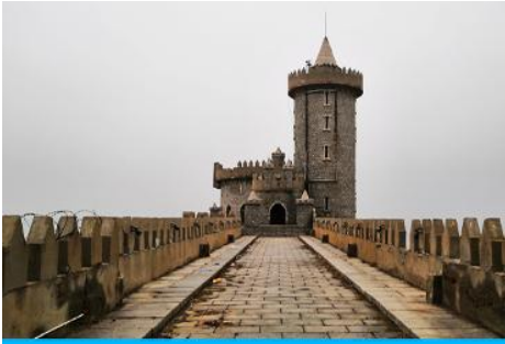
คาเฟ่อีสดง