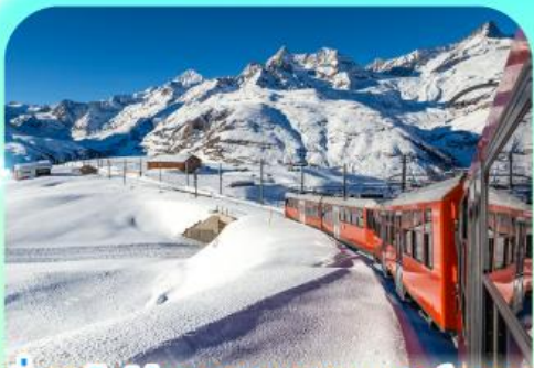
นั่งรถไฟสู่อยอดเขากรอนเนอร์เกรต