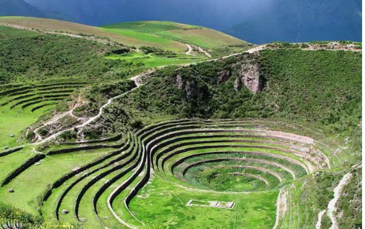
บาย นำท่านเดินทางสู่ มาราซ (Maras) แหล่งผลิตเกลือที่คุณภาพดีที่สุดในโลก ที่มีมาตั้งแต่สมัยอินคา แนว นาขั้นบันไดที่เรียงอยู่ตามลำดับความสูงของภูเขา จากนั้นเดินทางสู่ โมเรย์ (Moray) นาขั้นบันไดวงกลมขนาดใหญ่หลายารูปทรงแปลกตาที่ชาวอินคาทำ ไว้เพื่อทดลองปลูกพืชพันธุ์ต่างๆ จากจุดนี้สามารถมองเห็น หมู่บ้านอุрубัมบา (Urubamba) ได้อีกด้วย ได้เวลาเดินทางกลับสู่เมือง เมืองคัสโก (Cusco) เมืองหลวงของอาณาจักรอินคา ที่แพร่ขยายอำนาจจน กินพื้นที่ 1 ใน 3 ของอเมริกาใต้ ตั้งอยู่เหนือระดับน้ำทะเลถึง 3,400 เมตร และเป็นแหล่งอารยธรรมยุค ก่อนประวัติศาสตร์ที่ลึกลับน่าทึ่ง เป็นชุมชนเก่าแก่ของจักรวรรดิอินคาอันรุ่งเรือง ซึ่งยังคงทิ้งร่องรอยความ เจริญไว้ให้เห็นเป็นซากปรักหักพังโบราณและโบราณวัตถุต่างๆ