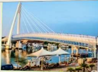
สะพานคู่รักต้นสุ่ย