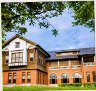
พิพิธภัณฑน์น้ำพุร้อนเป่ย์โถว