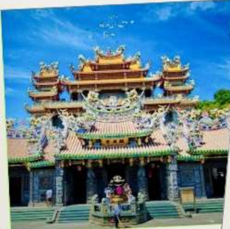
วัดกวนตุ๋