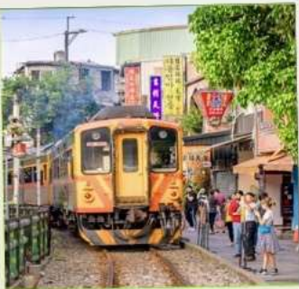
สถานีรถไฟสี้อเฟิ่น