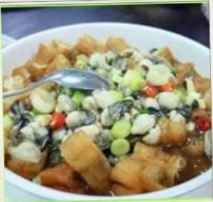
ถนนโบราณสี้อเฟิ่น