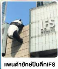
แพนด้ายักษ์ป็นตึกIFS