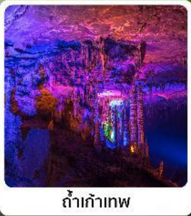
ดำเก้าทพ