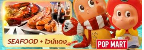
SEAFOOD + ไวน์แดง