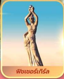
พีชเซอร์เกิร์ล