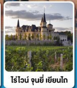
ไร่ไวน์ จุนยี่ เยียนไถ