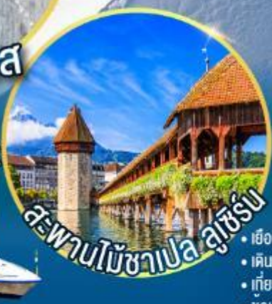
สะพานไม้อาเป ลูเซิร์น