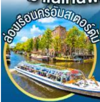
ล่องเรือครอัมสเตอร์ดัม