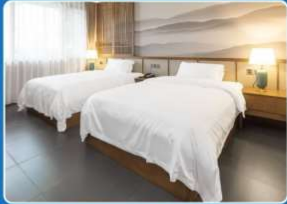
👤👤 TWIN (TWN)