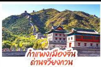
กำแพงเมืองจีน ด่านจวิงกวน

ล่องเรือสุดโรแมนติกแม่น้ำหวงผู้ ปักกิ่ง..เปิดประตูสู่แดนมังกร ด้วยความอลังการระดับจักรพรรดิ ชิงเต่า..เมืองชายทะเลสไตล์ยุโรป หอหุราแบบพ่นคล้าย เซี่ยงไฮ้..มหานครแห่งเอเชีย เมืองที่ไม่เคยหลับใหล