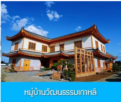
หมู่บ้านวัฒนธรรมเกาหลี

จากนั้นนำท่านเดินทางสู่เมืองตุนฮว่า 敦化 (ระยะทาง 130 กม. ใช้เวลาเดินทางราว 2 ชั่วโมง)