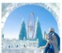
ICE & SNOW FEST.