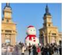
ตุ๊กตาหิมะยักษ์

โบสถ์ซันไฮเซย์ / คฤหาสน์บอลการ์ / โบลด์เฮนดมีคัส / Harbin Polar Park หมู่บ้านหิมะ: SNOW TOWN + กิจกรรมสาดน้ำร้อนกลางแจ้ง / เซาฉางดูช DREAM HOME (รวมค่าเช่า) / สนเสงกักตักกิมกิมเส่มู่เจีย + สนวนพาเหรดดิสนีย์ ภาพยนตร์ ICE AND SNOW (ฟรี Snow Tubing ท่าละ: 1 รอบ) ถนนจงหยาง (ฟรี! ไอศกรีมหน้าตึ๊ดเอ๋อส์) / เกาะพระอาทิตย์ (รวมรถแบดเจอร์) Harbin 2027 International Ice and Snow Festival / หอไอซ์ฮาร์ฮาร์ฮาร์ อุป๋นตุ๊กตาหิมะยักษ์ / ระเบิดงวมตึ๊ด / ทะพานกระจอกไฟประวัติศาสตร์