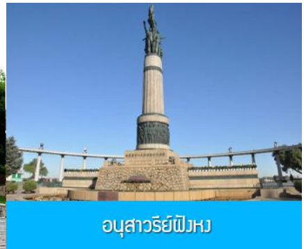
อนุสาวรีย์ฟิงหวง