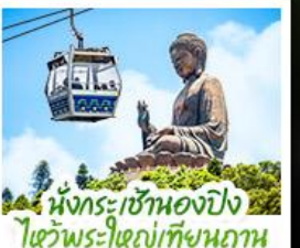
นั่งกระเช้าเองปีงลิการ์-พระใหญ่เทียนถาน