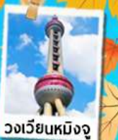
วงเวียนหมิงจู่