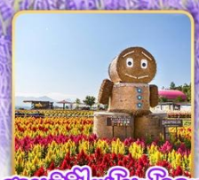
สวนซึกิไซโนะโอะกะ